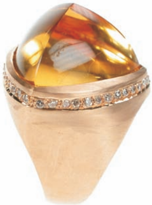
1398,-€ Brill. ca. 0,45 ct. w/ff Citrin ca. 24,36ct.