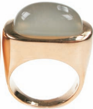
898,-€ Grauer Mondstein ca. 14,50 ct.