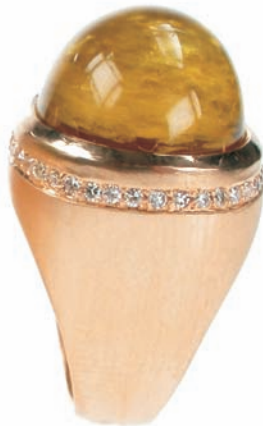
1548,-€ Brill. ca. 0,52 ct. tw/vvsi Goldberyll ca. 24,30 ct.