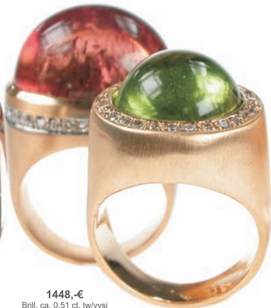
1448,-€ Brill. ca. 0,51 ct. tw/vvsi Rosa Turmalin ca. 30,50 ct.