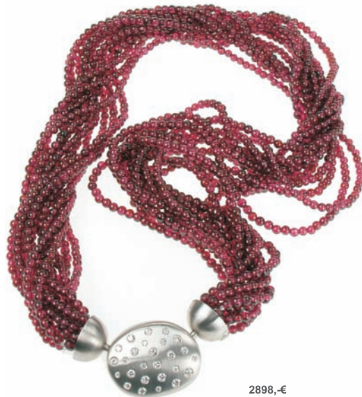
2898,-€ Brill. ca. 1,10 ct. tw/vsi