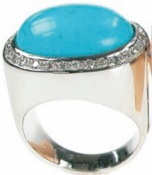
1398,-€ Brill. ca. 0,36 ct. tw/vvsi Türkis ca. 12,60 ct.