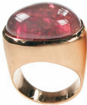
958,-€ Rosa Turmalin ca. 21,78 ct.