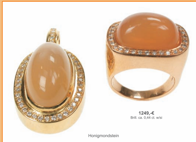
1649,-€ Brill. ca. 0,72 ct. w/si-pi