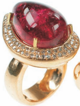
2998,-€ Brill. ca. 1,02 ct. tw/ff Rosa Turm. ca. 26,75ct.