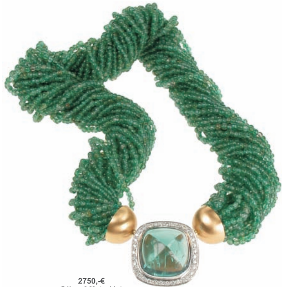
2750,-€ Brill. ca. 0,60 ct. w/si-pi Turmalin ca. 30,57 ct.