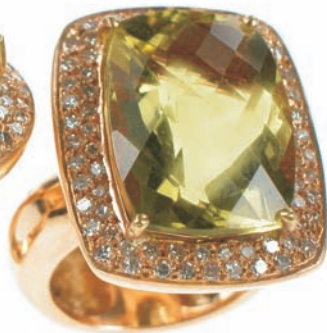
2298,-€ Brill. ca. 0,78 ct. tw/ff Lemoncitrin ca. 15,40ct.